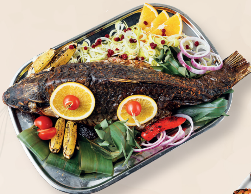
Сазан фаршированный капустой и икрой, 100 гр 260 ₽