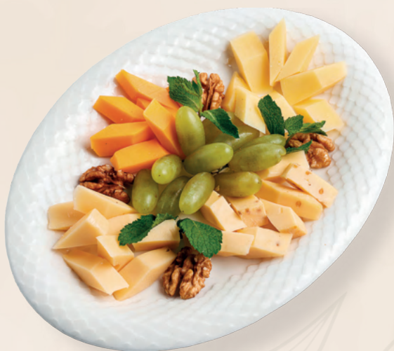
Ассорти сырное «Российское»

Камамбер, дорблю, пармезан выдержанный, пармезан молодой, виноград, орехи грецкие, мед, 200 гр