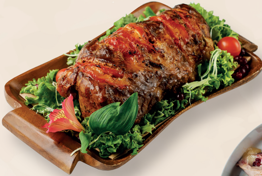
Свинина запеченная с томатами и сыром моцарелла 340 ₽ Шейная часть, 100 гр | Средний вес блюда 1000 гр