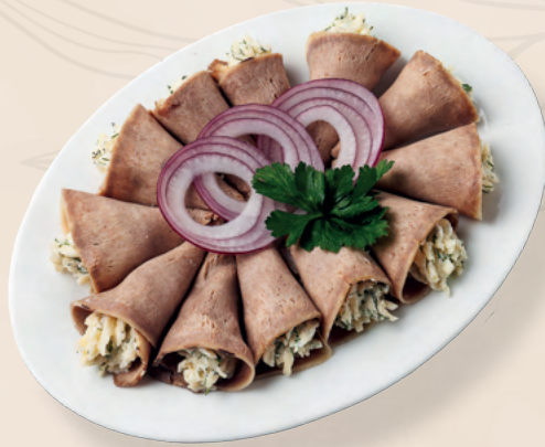
Рулетики из языка с сырно-чесночной начинкой, 300 гр