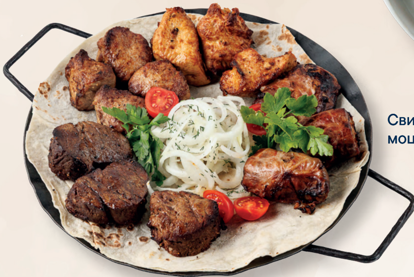
Садж мясной 6 200 ₽ Шашлык из говядины, индейки, свинины и язык в сетке, 1390 гр