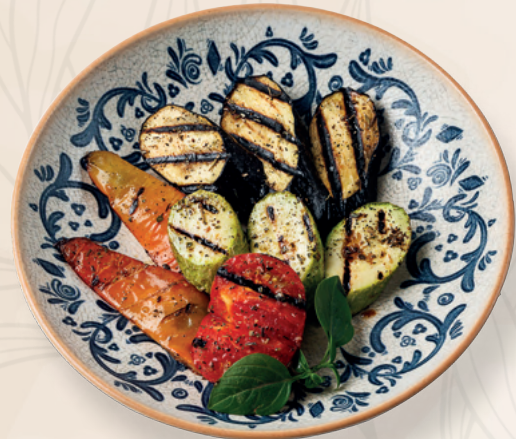
Овощи-гриль, 170 гр