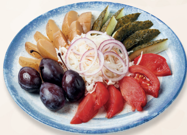
Ассорти из разносолов

Соленые томаты и огурцы, квашеная капуста, маринованные яблоки и сливы, 500 гр