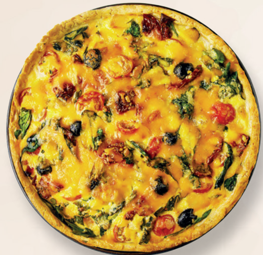
Киш с моцареллой, томатами и базиликом,