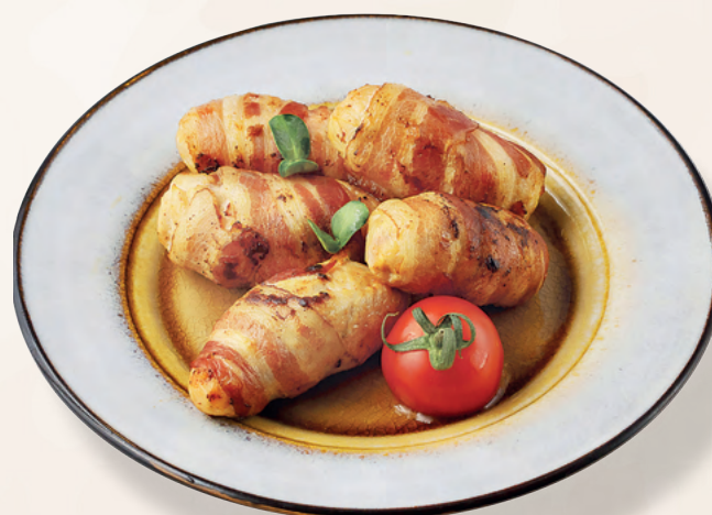
Пальчики куриные в беконе

Куриное филе, сливочный сыр, мясной бекон, 180 гр