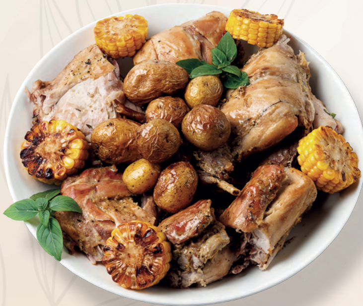
Кролик, запеченный целиком с печеным картофелем и пряными травами, 2000 гр