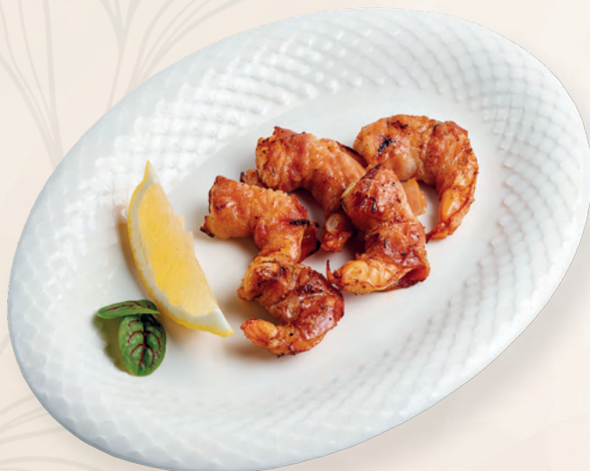
Креветки в беконе на 100 грамм 3-4 штуки, 100 гр