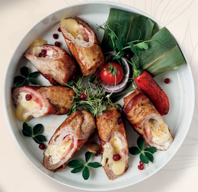
Свинина фаршированная сыром моцарелла в беконе, 570 гр 1800 ₽