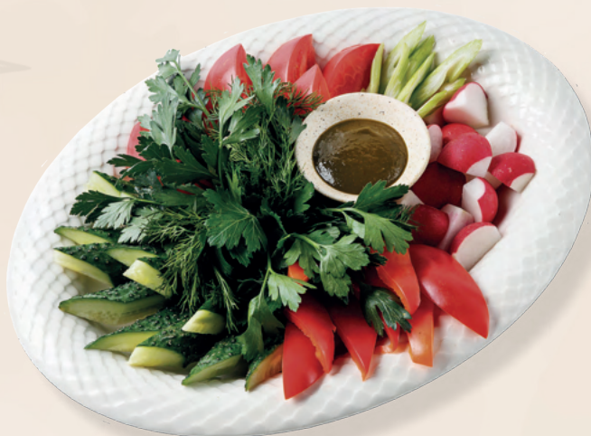
Ассорти из свежих овощей, Томаты, огурцы, болгарский перец, редис, зелень, 500 гр