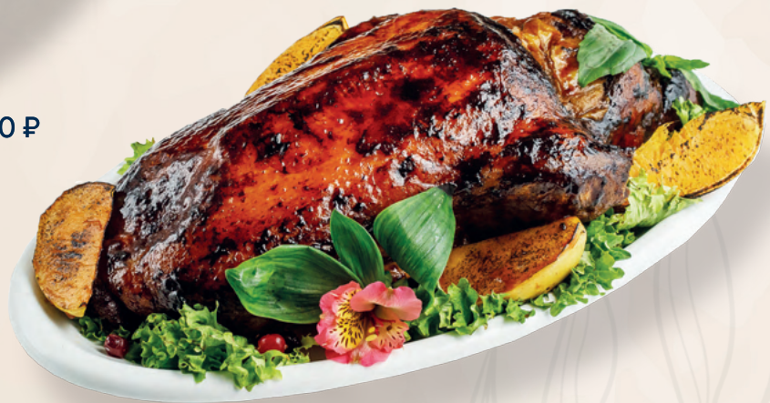
Утка в медово-горчичном маринаде с яблоками, 100 гр | Средний вес блюда 1500 гр