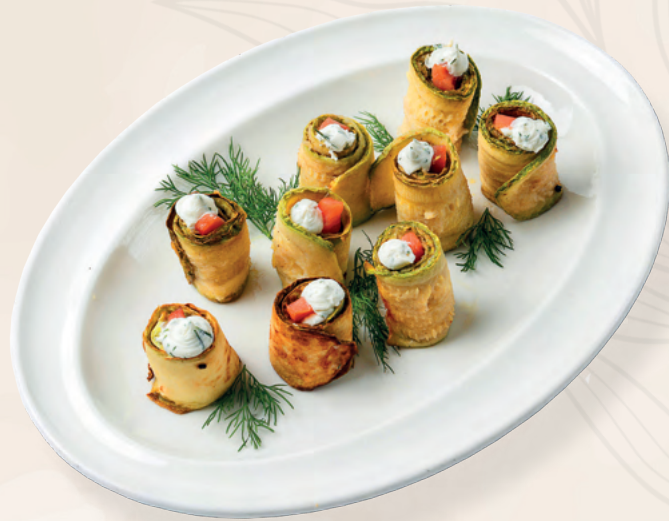
Рулетики из кабачков на гриле с горбушей и чиз-кремом, 270 гр