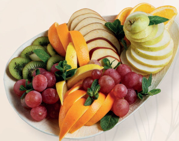
Ассорти фруктовое, 700 гр