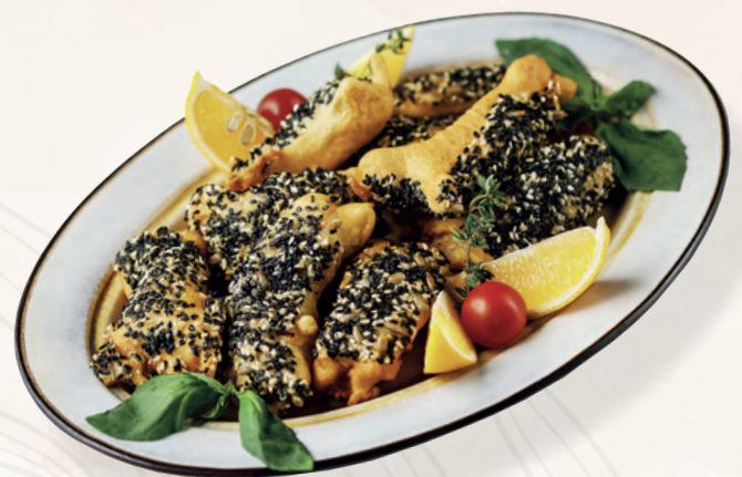
Судак в кунжуте,