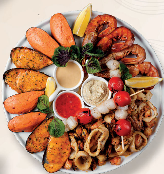
Плато из морепродуктов 6 900 ₽ Лангустины в остром соусе, запеченные с сыром мидии, морские гребешки жареные, морской коктейль, кальмары с итальянскими травами, 1200 гр