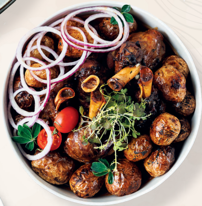
Томленая голень ягненка с печеным сливочным картофелем, 1420 гр