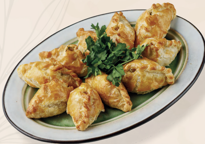
Расстегай с курицей / грибами, 1 шт

Блины, курица, грибы, 100 гр | Средний вес блюда 1500 гр