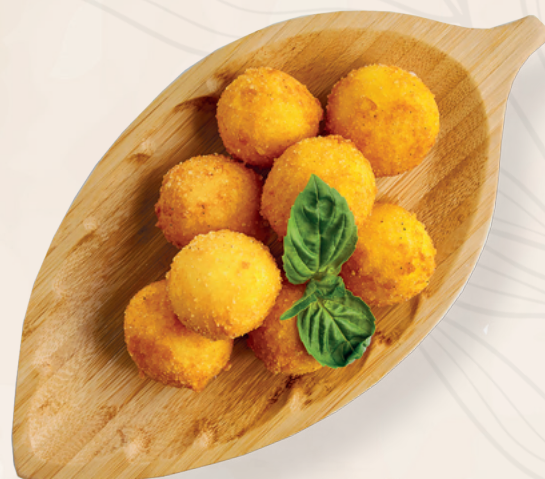
Сырный крокет с курицей