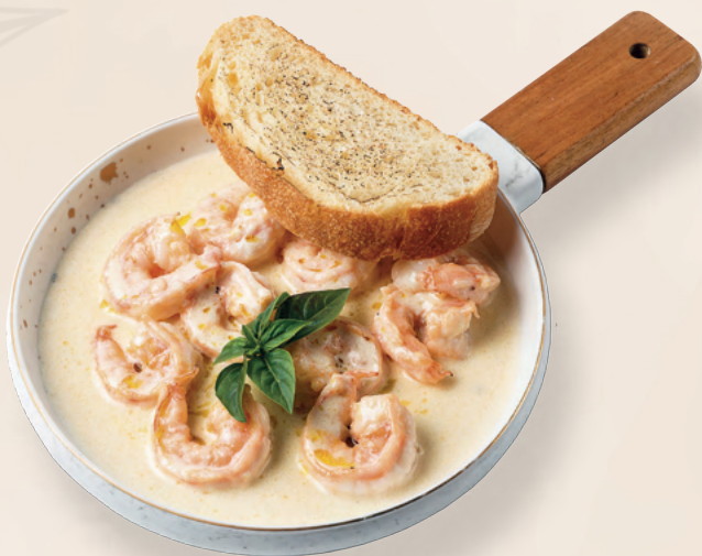
Креветки в сливочном соусе с чиабаттой, 460 гр