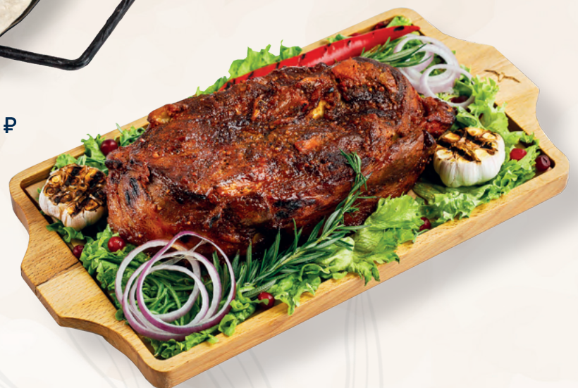
Лопатка телячья запеченная со специями, 100 гр 460 ₽ Средний вес блюда 2000 гр