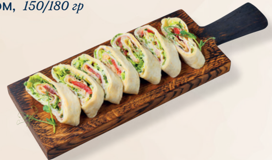
Рулет с ветчиной и сливочным сыром