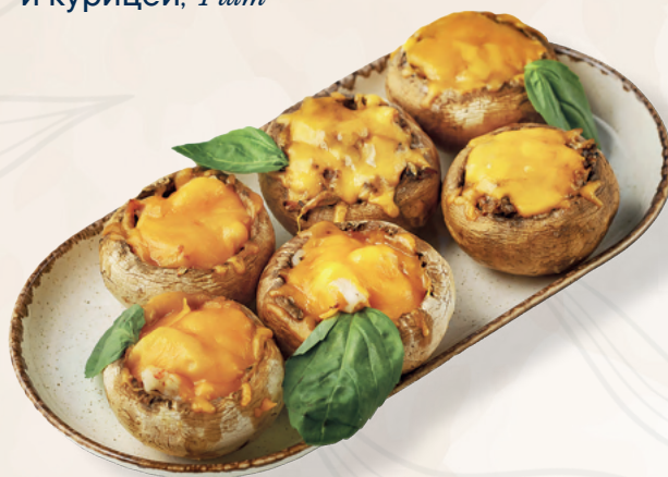
Шляпки шампиньонов фаршированные сыром, 1 шт