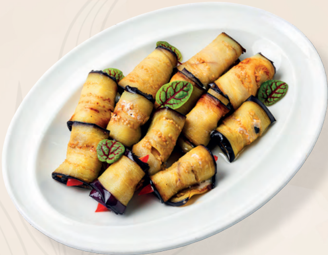
Рулетики из баклажан с орехово-чесночным соусом, 300 гр