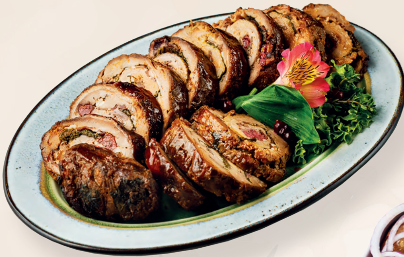
Руллет из утки с финиками и шпинатом, 100 гр | Средний вес блюда 1000 гр