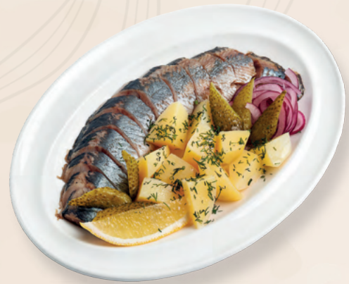
Сельдь с отварным картофелем, корншонами и маринованным луком, 150/180 гр