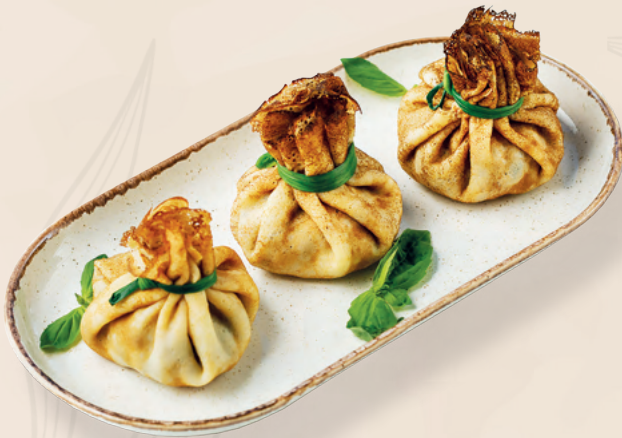
Блинный мешочек с грибами и курицей, 1 шт