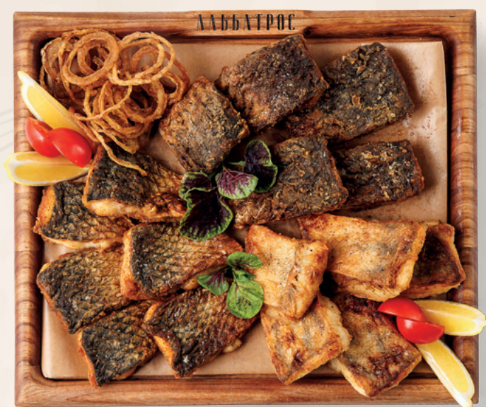
Ассорти рыбное «Донское» 3 600 ₽ Сазан жареный по-домашнему, судак жареный, кефаль жареная, 1120 гр