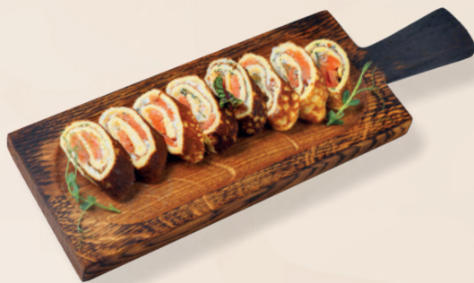
Рулет с семгой слабосоленой и омлетом, 200 гр