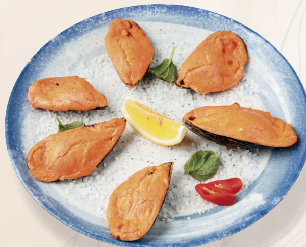
Мидии запеченные с лангустинами и соусом спайси- чиз, 320 гр