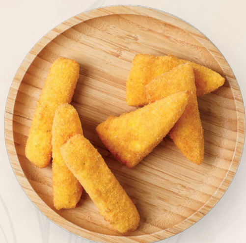
Моцарелла жареная, 130 гр