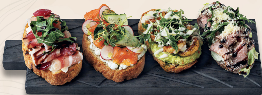
Брускетта с пармской ветчиной, 180 гр

Ветчина, сливочный сыр, томаты, огурцы, лист салата, чеснок, зелень, лаваш тонкий, 360 гр