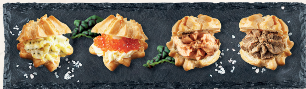
Профитроли с сырной начинкой, 1 шт