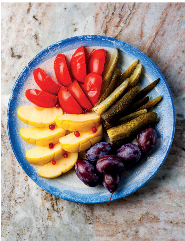
Ассорти разносолов, 400 гр