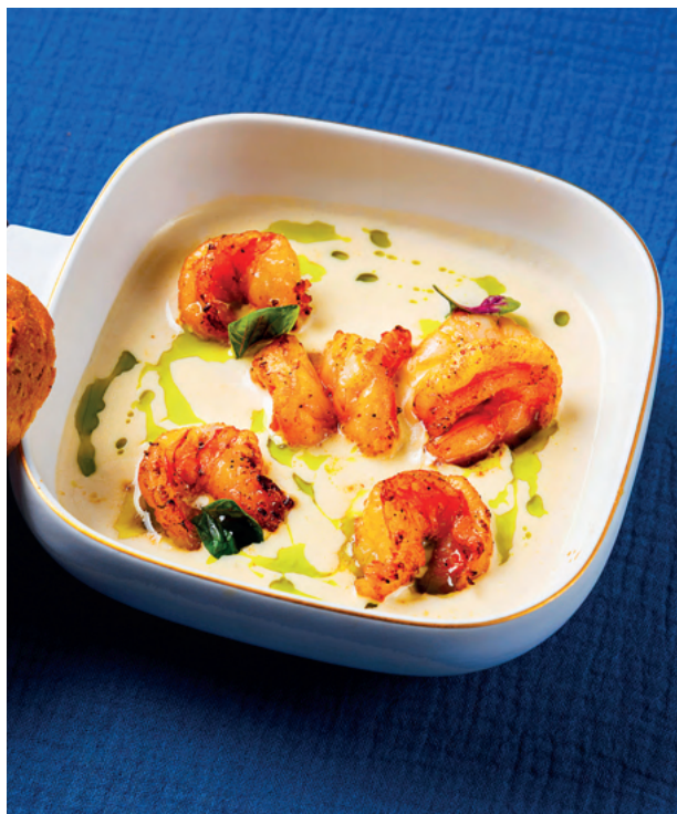
Креветки в сливочном соусе, 235 гр