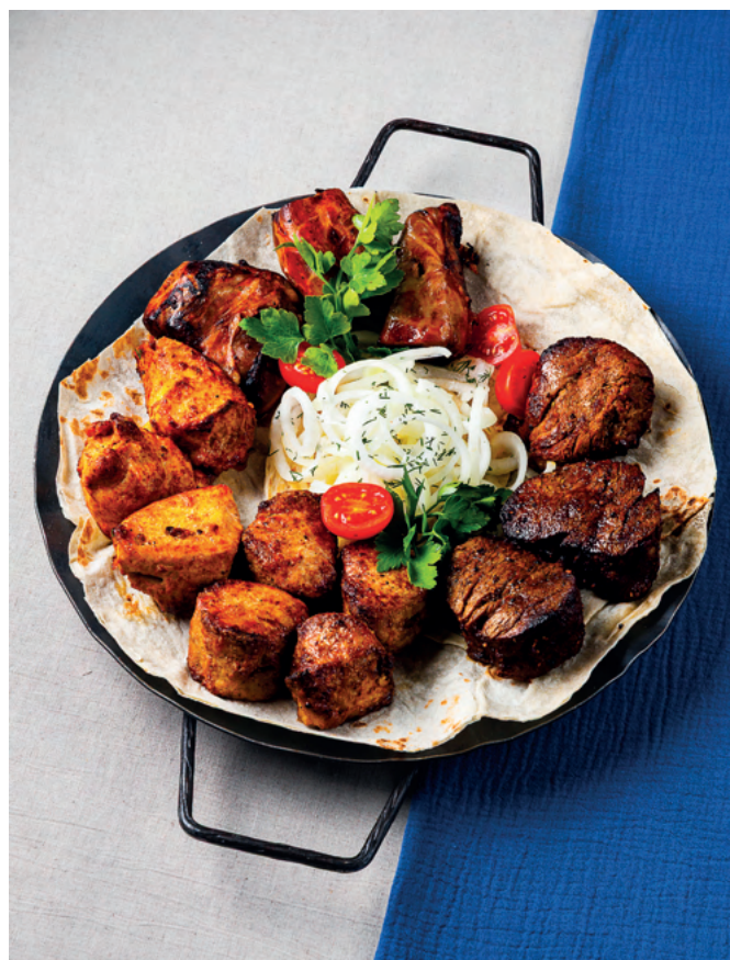
Садж мясной, 1 430 гр 6 200 ₺

Шашлык из говядины, язык говяжий в сетке, шашлык из филе индейки, шашлык из свинины, маринованный лук