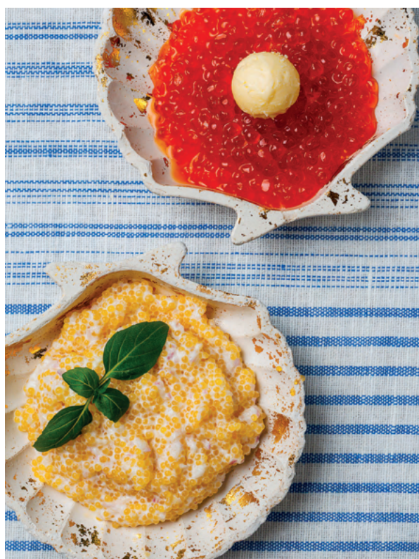
Икра щуцья в сливках с ялтинским луком, 50 гр