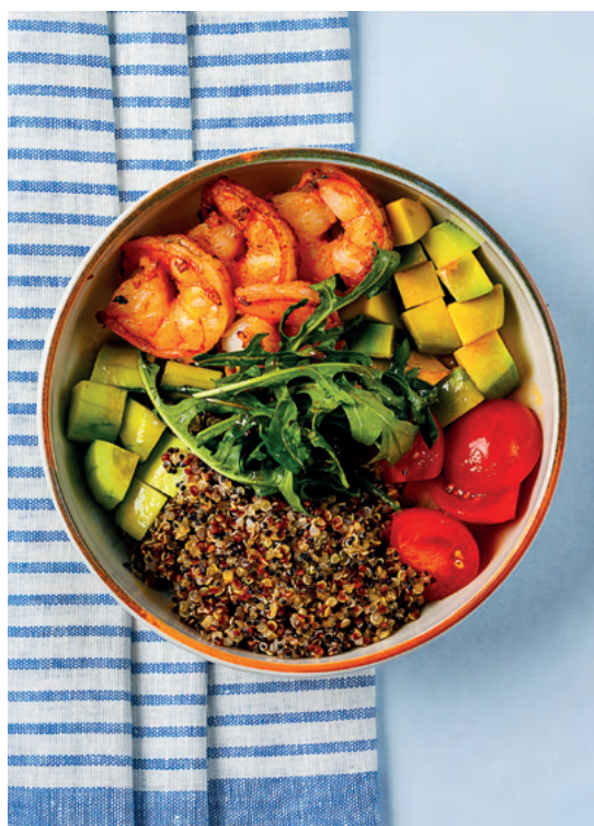
Боул с креветками, 235 гр