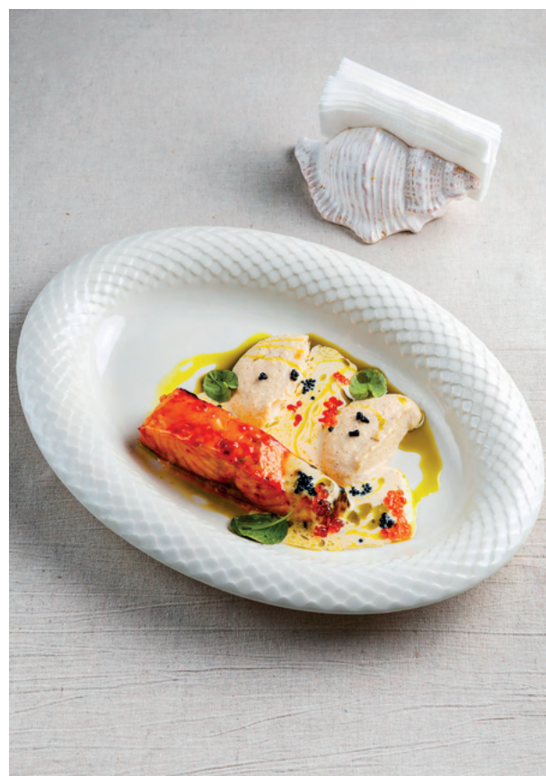
Стейк из лосося с пюре из цветной капусты и икорным соусом, 210 гр