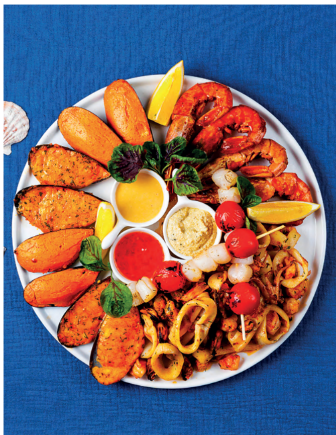
Плато из морепродуктов, 1 400 гр 5 200 ₺

Морской гребешок, лангустины жареные, мидии запечённые с сыром, мидии фаршированные лангустинами со спайси-соусом, микс морепродуктов с итальянскими травами.