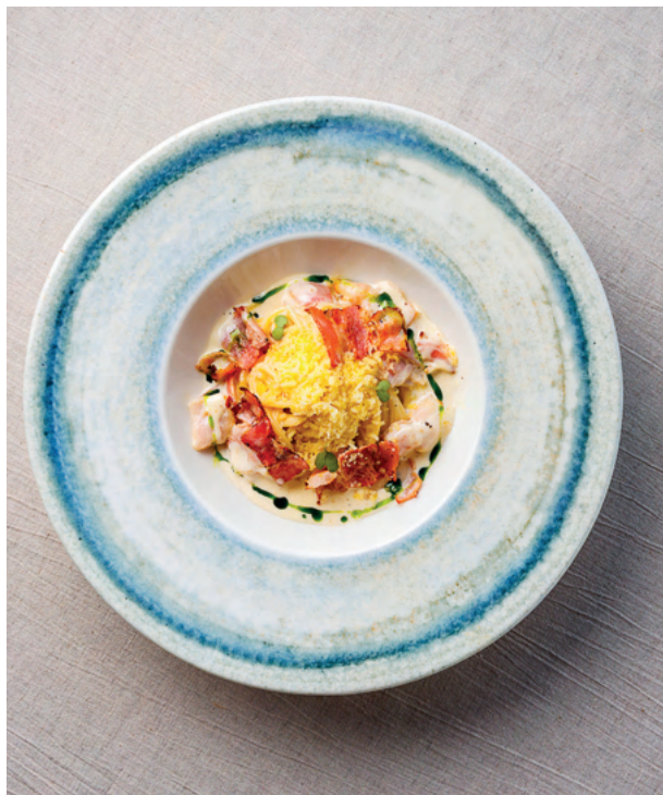
Карбонара, 300 гр