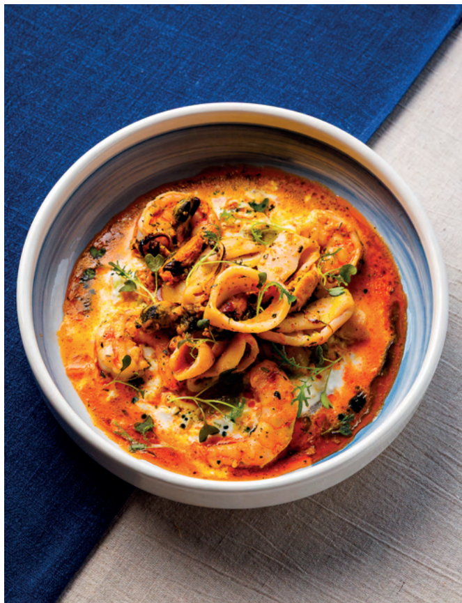
Морепродукты с мягким домашним сыром и шпинатом, 340 гр