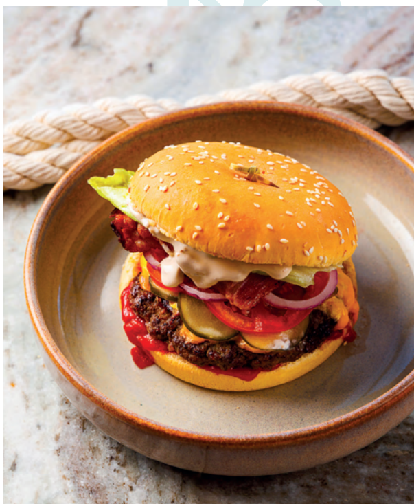
Бургер с котлетой из мраморной говядины, 380 гр