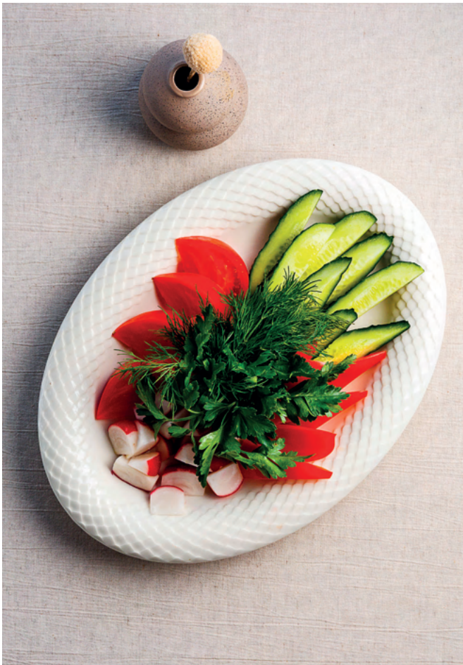
Ассорти из свежих овощей, 450 гр