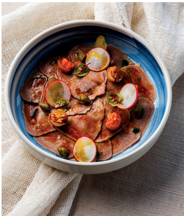
Тартар из лосося с гуакамоле, 150 гр