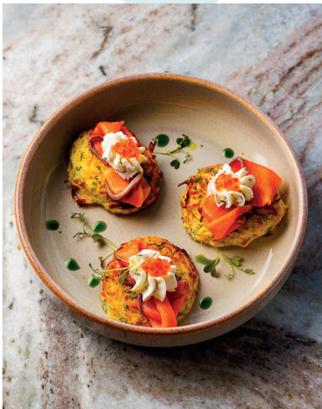
Драники с семгой слабосоленой и сливочным сыром, 240 гр