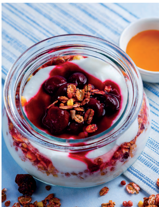
Гранола с мацони и соусом из вишни, 260 гр