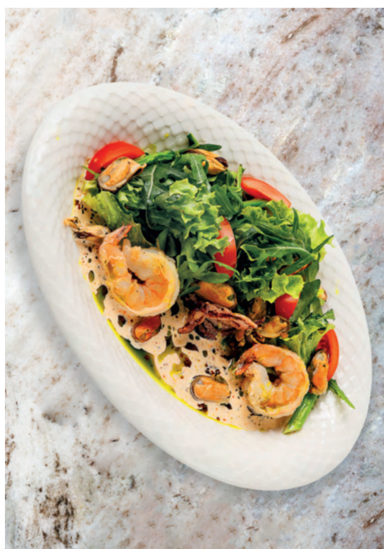
Салат с морепродуктами в теплом сливочном соусе, 285 гр 890 ₽

Тигровые креветки, осьминог, мидии, спаржа, томаты черри, микс салата, заправка