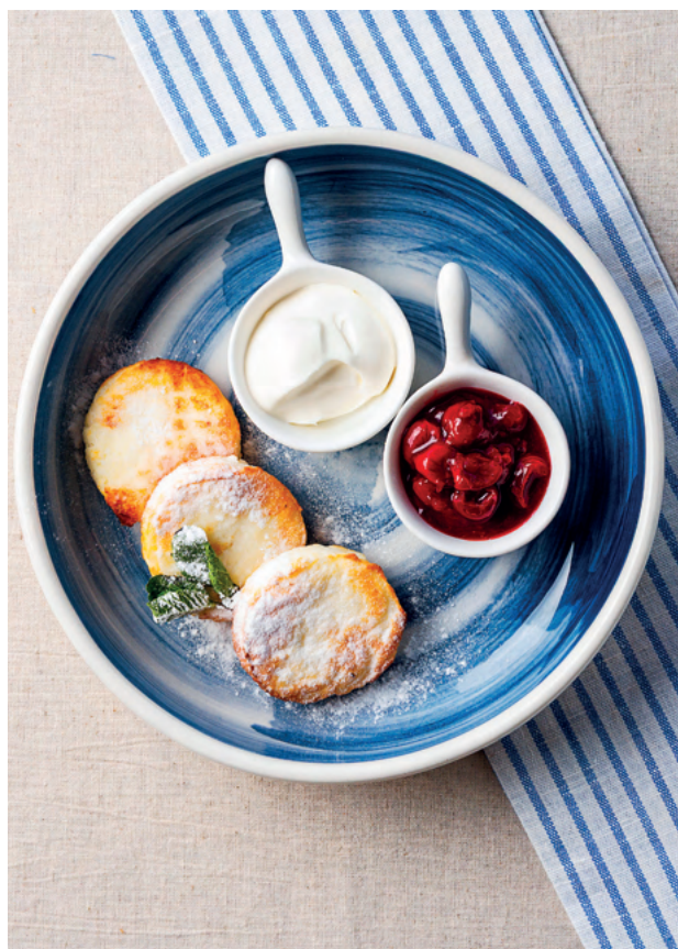
Сырники со сметаной и вишневым соусом, 170 гр