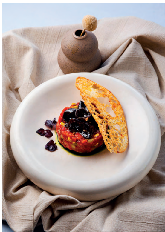
Тартар из мраморной телятины с грибами муэр, 165 гр