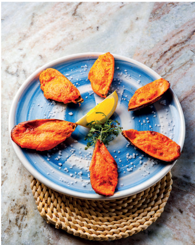
Острые запеченные мидии с соусом спайси-чиз, 195 гр