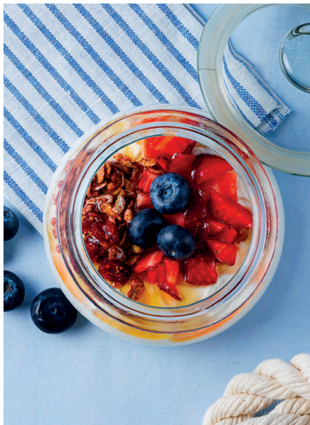
Овсяная каша с яблоком и кедровыми орешками, 190 гр