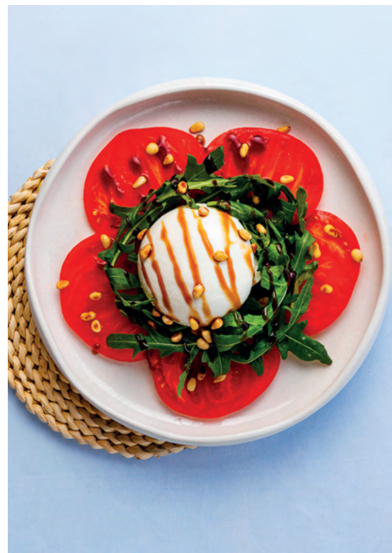
Буратта с карпаччо из томатов, 245 гр

Болгарский перец, редис, томаты, огурец свежий, зелень