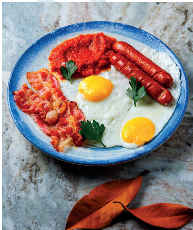
Большой завтрак, 350 гр