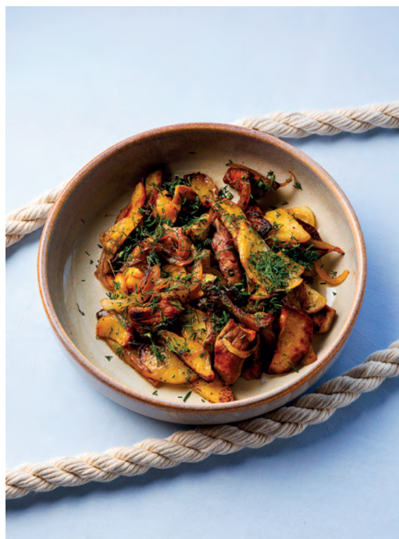
Жаркое «Сковородка» по-домашнему, 300 гр

Обжаренная свинина с картофелем, грибами, луком и зеленью.