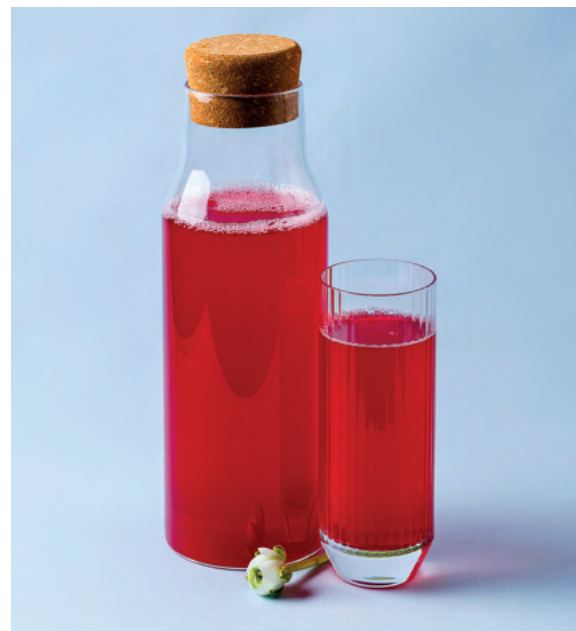
Клюквенный с медом, 1 л 690 ₹