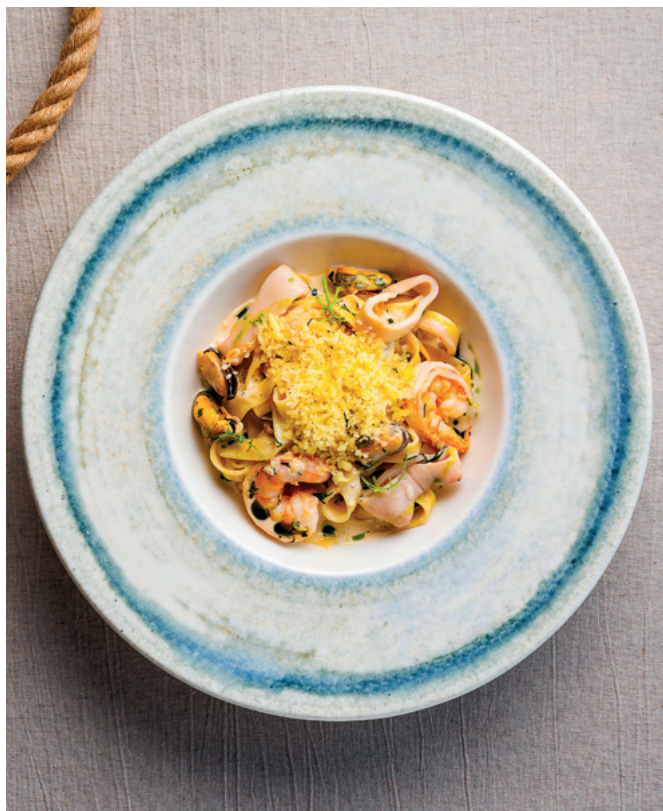
Паста с морепродуктами в сливочном соусе, 300 гр