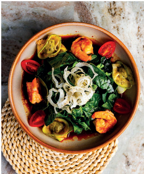
Салат с креветками, цукини и соусом рамиро, 240 гр 690 ₽