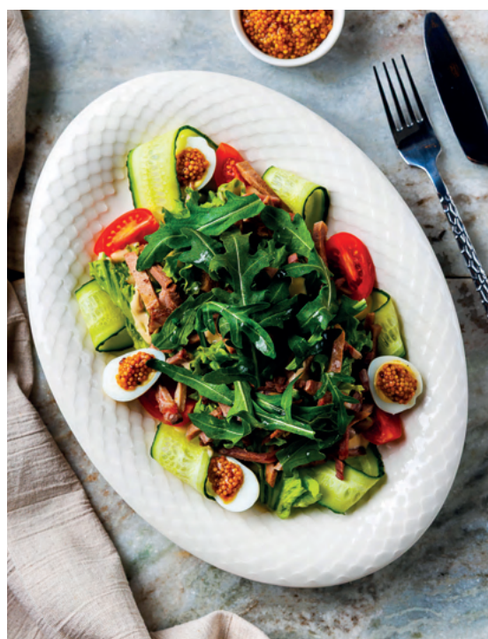
Салат «Альбатрос», 200 гр 690 ₽

Тигровые креветки, осьминог, мидии, спаржа, томаты черри, микс салата, заправка